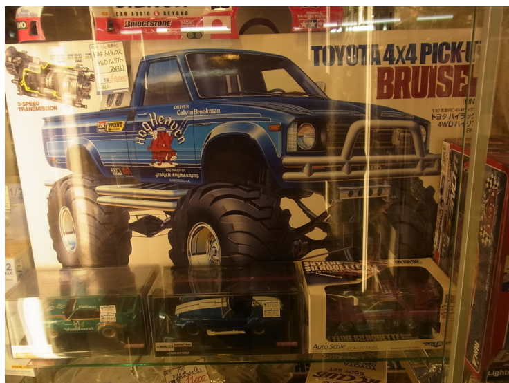
TAMIYA 1/10 トヨタハイラックス 4WD ハイリフト (RN36) 価格：6万6000円 (税込)