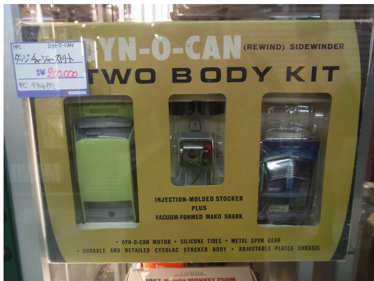
MPC 1/24 DYN-O-CAN TWO BODY KIT