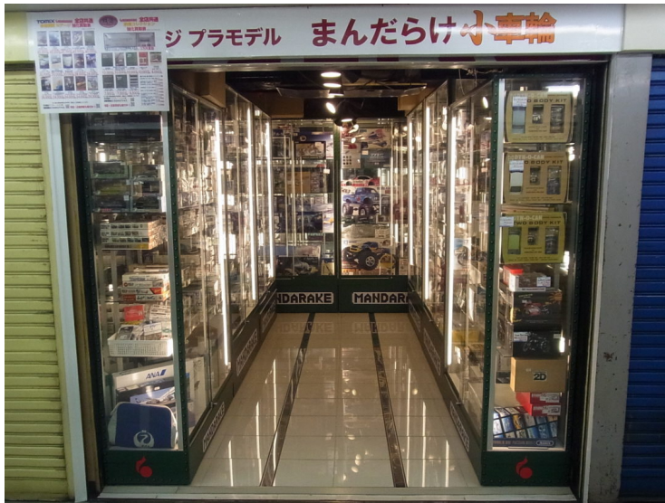
国内外メーカーのクルマ系プラモデル。