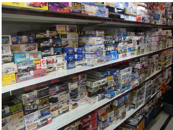
入って左側は、クルマなどのプラモデル中心のラインナップ。

一步店内に入ると、子どもの頃に憧れたレースカーやスーパーカーに代表されるクルマのプラモデルや、戦車や飛行機などのミリタリーモデル、ミニ四駆などが所狭しと並んでいます。