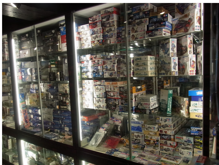
右側は、ミニ四駆やミリタリー系などが展示されてます。