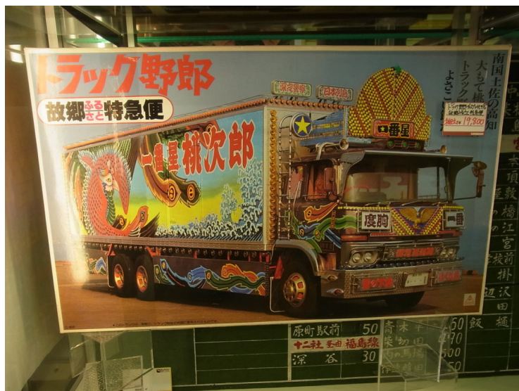
バンダイ 1/20 トラック野郎 故郷ふるさと特急便（未組立）価格：1万9800円（税込）

一步店内に入ると、子どもの頃に憧れたレースカーやスーパーカーに代表されるクルマのプラモデルや、戦車や飛行機などのミリタリーモデル、ミニ四駆などが所狭しと並んでいます。