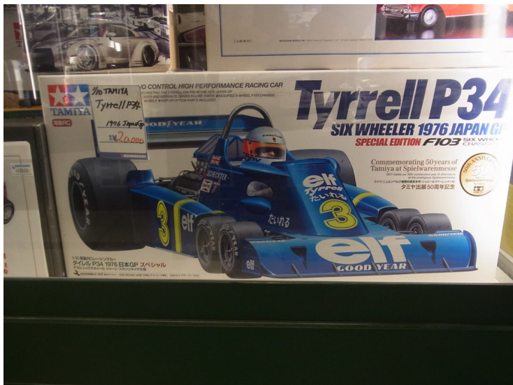
TAMIYA 1/10 Tyrrell P34 (SIX WHEELER 1976 JAPAN GP) 価格：2万2000円（税込）